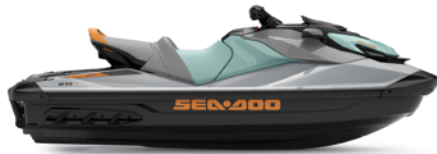
GTI™ SE 130