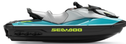
GTI™ SE 170